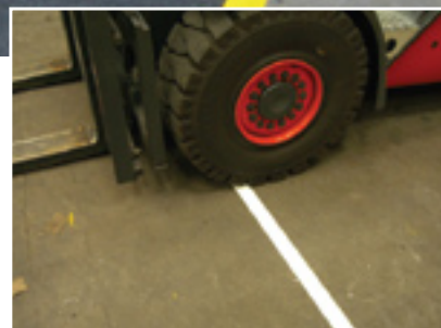
Supporte le passage des chariots